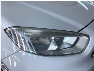
Farlar, Far, sağ > Solmuş