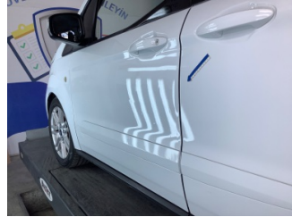
Kapı, sol ön, Kapı, sol ön > Hasarlı