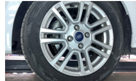
Jant, sol ön > Hasarlı