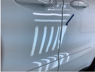
Kapı, sol ön, Kapı, sol ön > Hasarlı