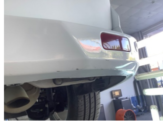
Tampon, arka, Arka tampon > Çizik