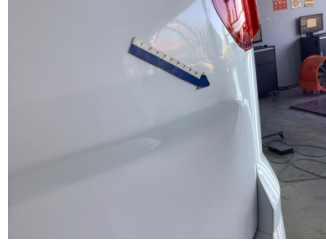
Bagaj kapağı/kapısı, Bagaj kapısı > Hasarlı