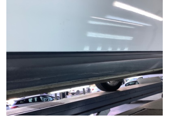
Marşbiyel, sol, Marşbiyel plastiği, sol > Çizik