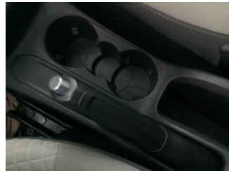
Pedallar, El freni kolu > Deforme Olmuş