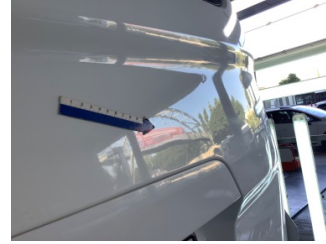
Bagaj kapağı/kapısı, Bagaj kapısı > Ezik