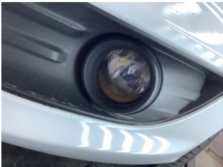
Sis lambaları, Sis farı, sol > Hasarlı