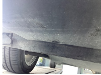
Tampon, ön, Spoiler > Hasarlı