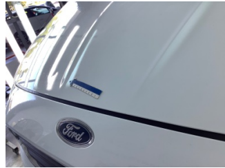
Motor kaputu, Motor kaputu > Ezik