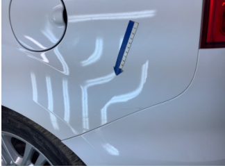
Çamurluk, sol arka, Çamurluk, sol arka > Çizik