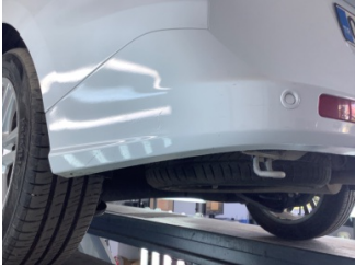
Tampon, arka, Arka tampon > Çizik