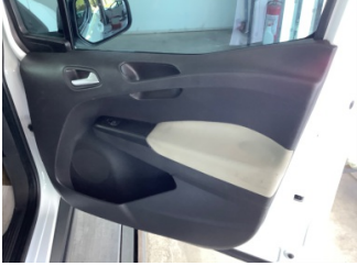
Döşemeler/Kapaklar, Kapı döşemesi, sağ ön > Hasarlı