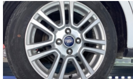
Jant, sağ arka > Hasarlı