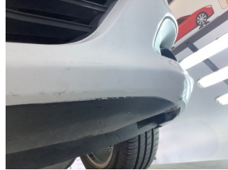
Tampon, ön, Ön tampon > Hasarlı