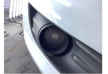
Sis lambaları, Sis farı, sağ > Deforme Olmuş