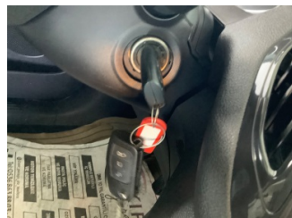
Dokümantasyon ve Ekipmanlar, Araç anahtarı > Arızalı