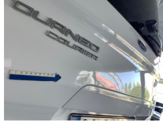
Bagaj kapağı/kapısı, Bagaj kapısı > Ezik