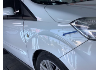
Çamurluk, sağ, Çamurluk, sağ > Çizik