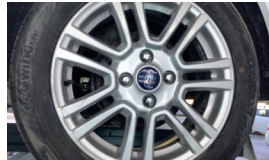
Jant, sol arka > Hasarlı