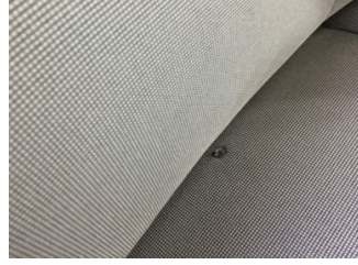
Koltuklar, ön, Koltuk, sağ ön > Hasarlı