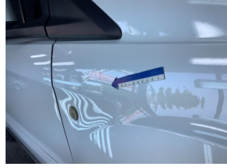
Çamurluk, sağ, Çamurluk, sağ > Standart Dışı Onarım