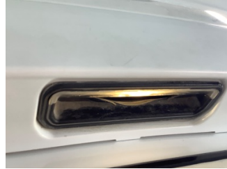
Bagaj kapağı/kapısı, Kilit mekanizması > Arızalı