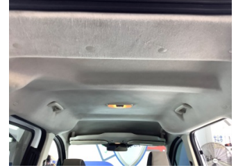
Döşemeler/Kapaklar, Tavan döşemesi > Deforme Olmuş