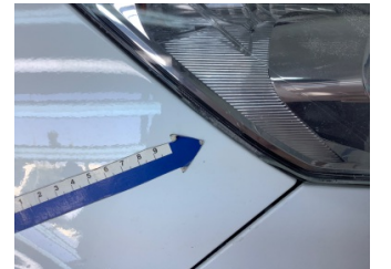
Farlar, Far camı, sağ > Çatlak