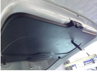
Döşemeler/Kapaklar, Bagaj kapağı, iç döşemesi > Çizik

Sayfa: 8/14 Araç Çıkış Tarihi: 08.11.2022 17:12