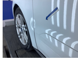
Kapı, sol ön, Kapı, sol ön > Hasarlı