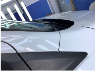
Tavan, Ön cam direği, sağ > Ezik