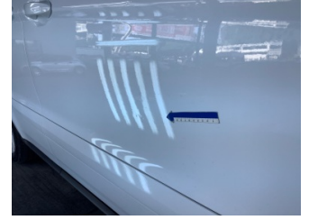
Kapı, sağ ön, Kapı, sağ ön > Ezik