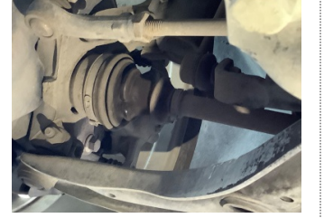
Ön aks, Aks mili, toz körüğü, sol > Hasarlı