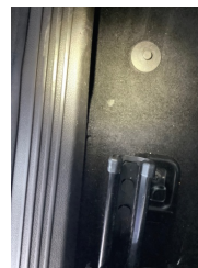
Taban, Taban halısı > Yakıcı Madde Ile Zarar Görmüş