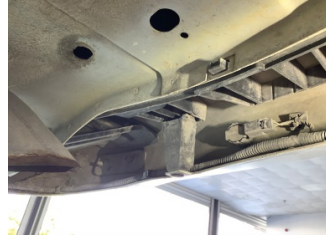
Tampon, arka, Bağlantı ayağı > Hasarlı