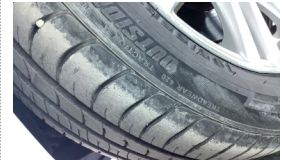
Tekerlek seti > Aşınmış