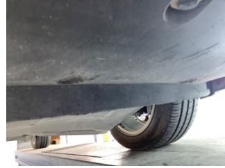
Tampon, ön, Spoiler > Hasarlı