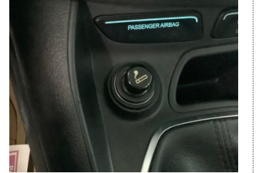
Elektrik donanımı/Pano, Çakmak > Çalışmıyor