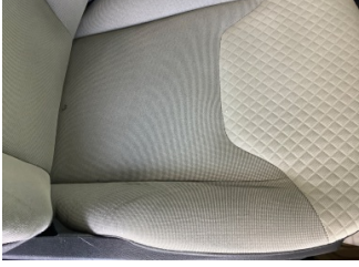
Koltuklar, ön, Koltuk, sağ ön > Hasarlı

Sayfa: 10/14 Araç Çıkış Tarihi: 08.11.2022 17:12