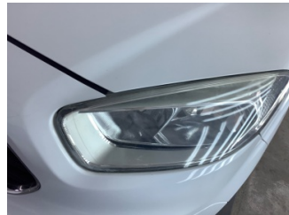
Farlar, Far, sol > Solmuş