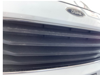
İlave parçalar, ön, Ön panjur > Hasarlı