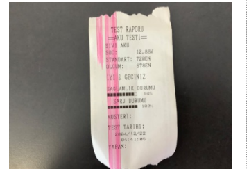
Elektrik donanımı/Pano, Akü > Test Sonucu