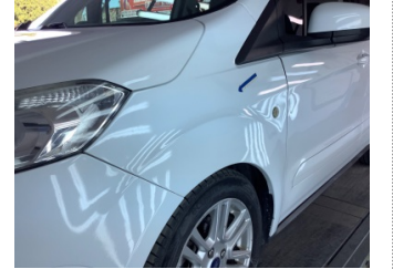
Çamurluk, sol, Çamurluk, sol > Deforme Olmuş