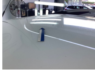
Tavan, Tavan > Ezik