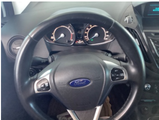
Direksiyon sistemi, Direksiyon simidi > Deforme Olmuş