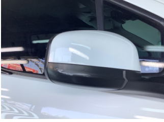
Dikiz aynası, sağ, Dış dikiz aynası kapağı > Hasarlı

Sayfa: 11/14 Araç Çıkış Tarihi: 08.11.2022 17:12