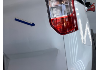
Bagaj kapağı/kapısı, Bagaj kapısı > Hasarlı