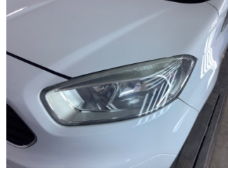
Farlar, Far, sol > Çizik