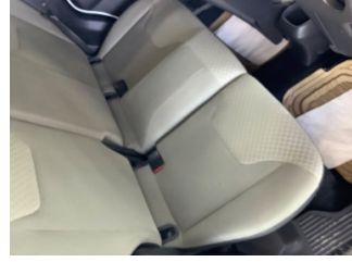
Koltuklar, arka, Arka koltuk > Yakıcı Madde ile Zarar Görmüş