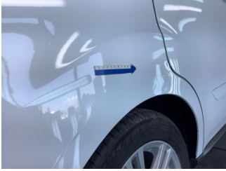
Çamurluk, sağ arka, Çamurluk, sağ arka > Ezik