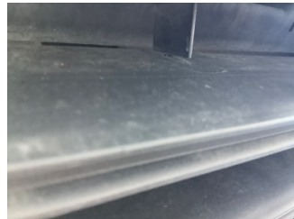
İlave parçalar, ön, Ön panjur > Hasarlı