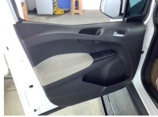
Döşemeler/Kapaklar, Kapı döşemesi, sol ön > Deforme Olmuş