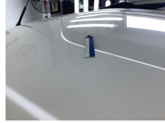
Tavan, Tavan > Ezik