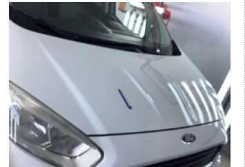
Motor kaputu, Motor kaputu > Taş İzi