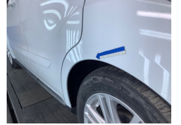
Çamurluk, sol arka, Çamurluk, sol arka > Ezik