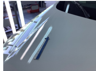
Motor kaputu, Motor kaputu > Standart Dışı Onarım