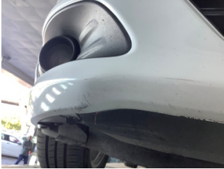
Tampon, ön, Ön tampon > Hasarlı