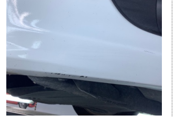
Tampon, ön, Ön tampon > Hasarlı