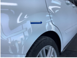
Çamurluk, sağ arka, Çamurluk, sağ arka > Standart Dışı Onarım