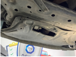
Motor, Alt muhafaza > Hasarlı