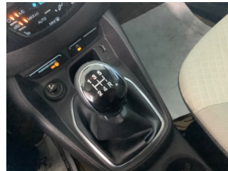
Şanzıman, Vites topuzu > Deforme Olmuş