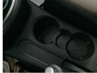
Pano/Göstergeler, Küllük > Sökülmüş-Yok