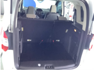
Döşemeler/Kapaklar, Pandizot > Sökülmüş-Yok