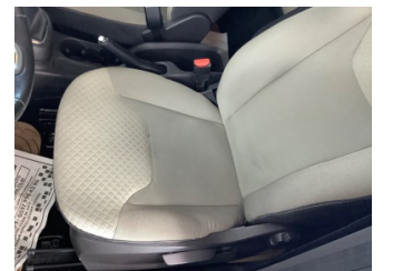
Koltuklar, ön, Koltuk, sol ön > Hasarlı