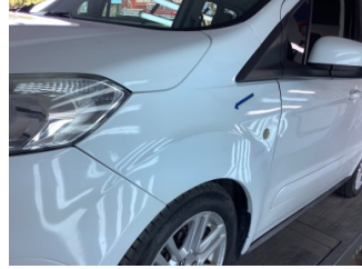
Çamurluk, sol, Çamurluk, sol > Çizik