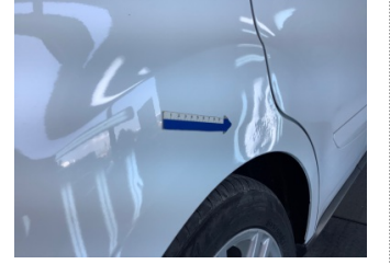
Çamurluk, sağ arka, Çamurluk, sağ arka > Standart Dışı Onarım