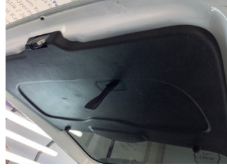
Döşemeler/Kapaklar, Bagaj kapağı, iç döşemesi > Çizik