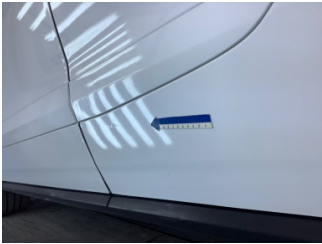
Kapı, sol arka, Kapı, sol arka > Ezik