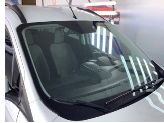
Camlar, Ön cam > Taş izi