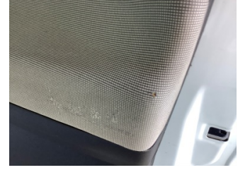
Döşemeler/Kapaklar, Kapı döşemesi, sağ ön > Hasarlı