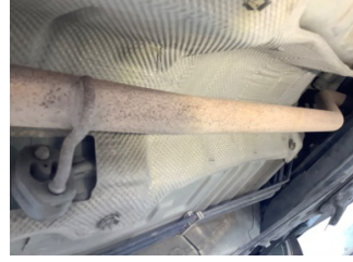
Egzoz sistemi, Arka boru > Pas