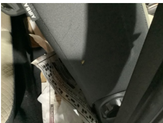
Koltuklar, ön, Koltuk, sağ ön > Yakıcı Madde Ile Zarar Görmüş