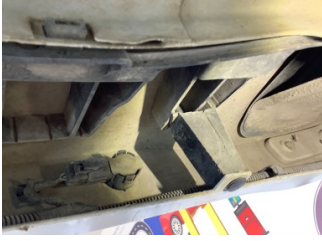
Tampon, arka, Bağlantı ayağı > Hasarlı

Sayfa: 12/14 Araç Çıkış Tarihi: 08.11.2022 17:12