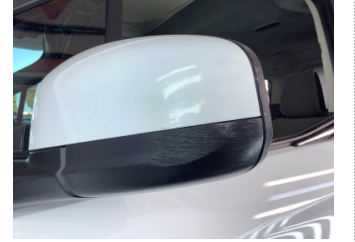
Dikiz aynası, sol, Dış dikiz aynası kapağı > Hasarlı