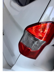
Bagaj kapağı/kapısı, Bagaj kapısı > Ayarsız