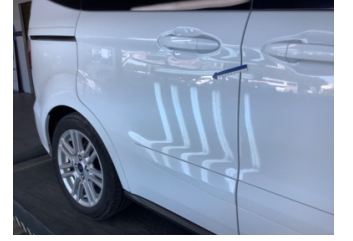
Kapı, sağ arka, Kapı, sağ arka > Çizik