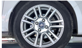
Jant, sağ ön > Hasarlı