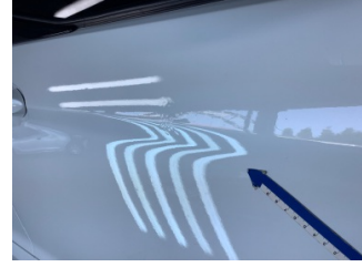
Kapı, sağ ön, Kapı, sağ ön > Standart Dışı Onarım