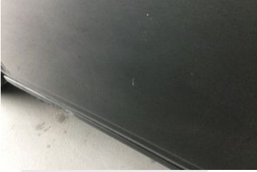
SOL ÖN KAPI