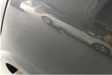
SOL ARKA ÇAMURLUK