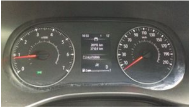
11. Araç içi kadran