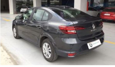
4. Sol Arka Çapraz