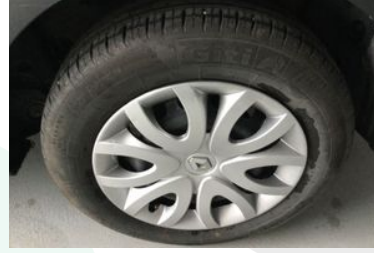
Sol Arka Lastik