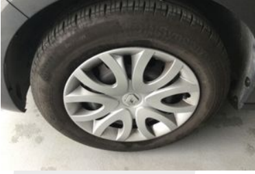
Sol Ön Lastik