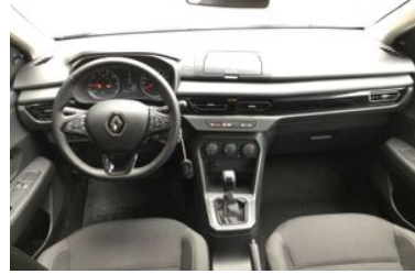
6. Araç için ön Konsol