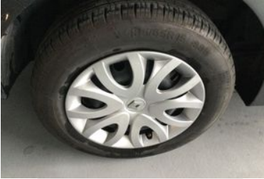
Sağ Arka Lastik