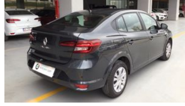
3. Sağ Arka Çapraz