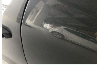
SOL ARKA KAPI