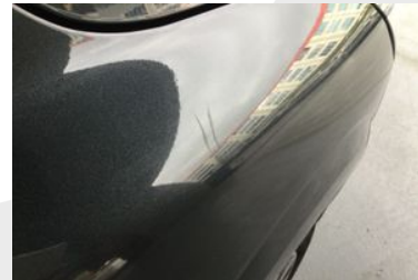
SAĞ ÖN ÇAMURLUK