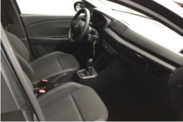
7. Araç içi sağ ön sıra