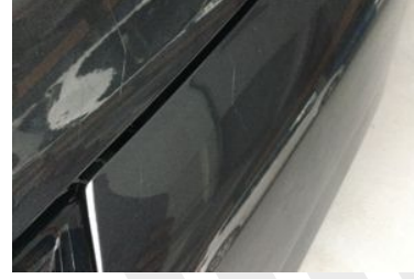
SOL ÖN ÇAMURLUK