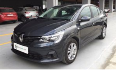
1. Sol Ön Çapraz