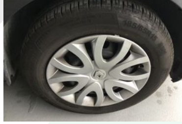
Sağ Ön Lastik