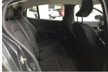
8. Araç içi sağ arka sıra