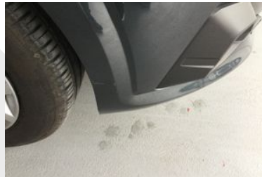
Ön tampon çizik