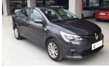
2. Sağ Ön Çapraz