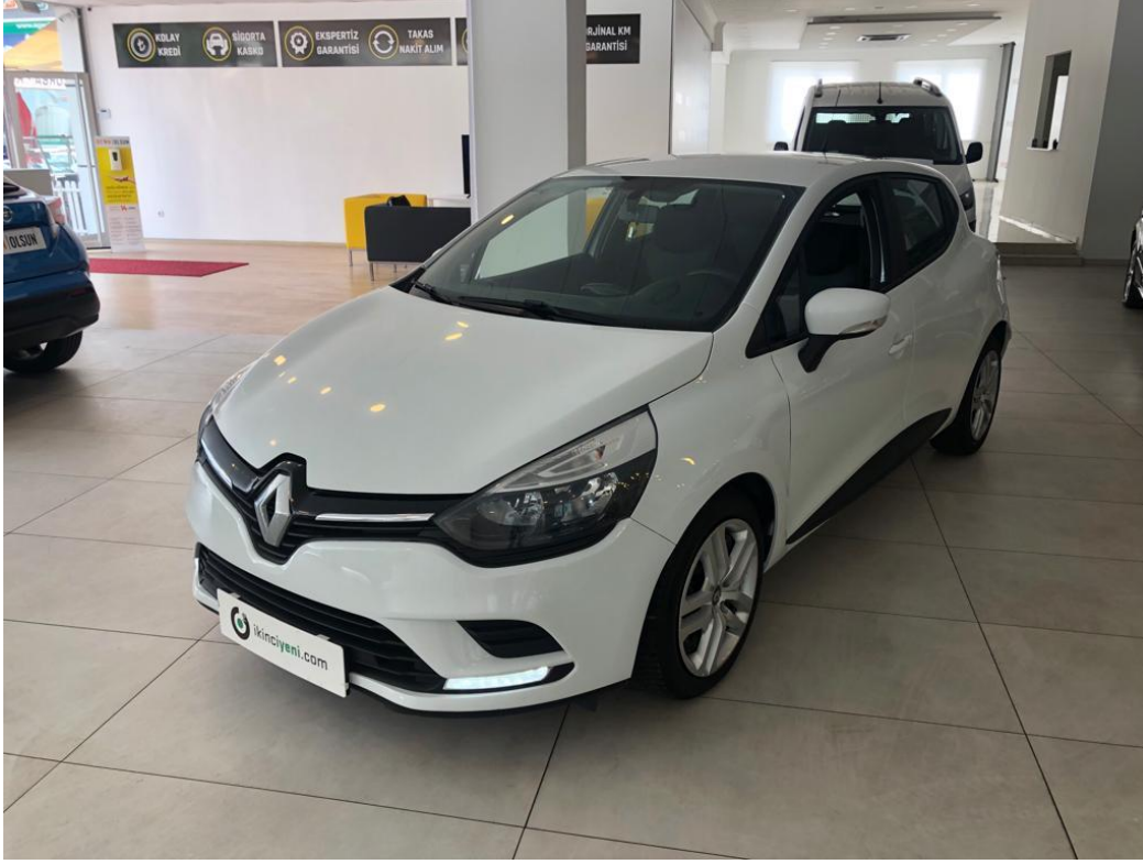
ARAÇ KAPAK GÖRSELİ